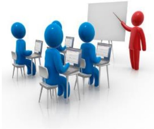
آموزش و مشاوره دائمی