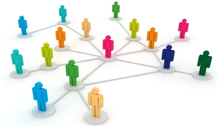
شبکه سازی و توسعه ارتباطات شخصی